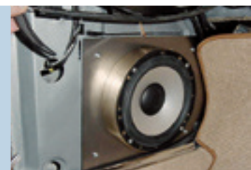
Massiver Rotgussring für 16 cm-Laut- sprecher mit verschraubter Blechplatte an Original-Aufnahmepunkten