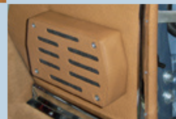
2-Wege-Frontsystem für den Fußraum eines W111