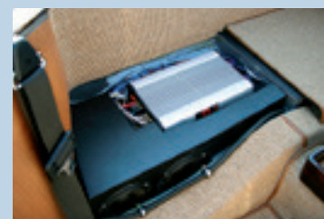
Optimiertes GFK-Subwoofergehäuse mit integrierter 4-Kanal-Endstufe für W113